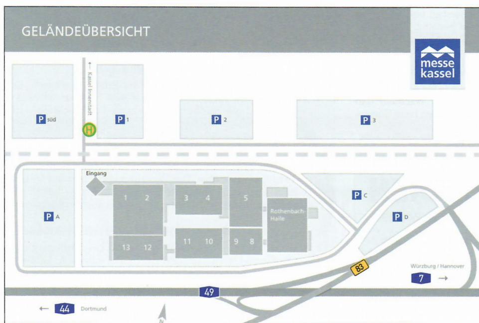
Geländeübersicht zur Orientierung

mit der Züchternummer auf dem Ring übereinstimmt, wird der Vogel disqualifiziert.