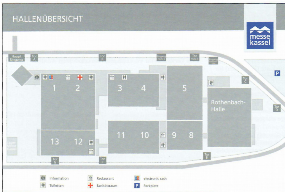
Hallenübersicht zur Orientierung