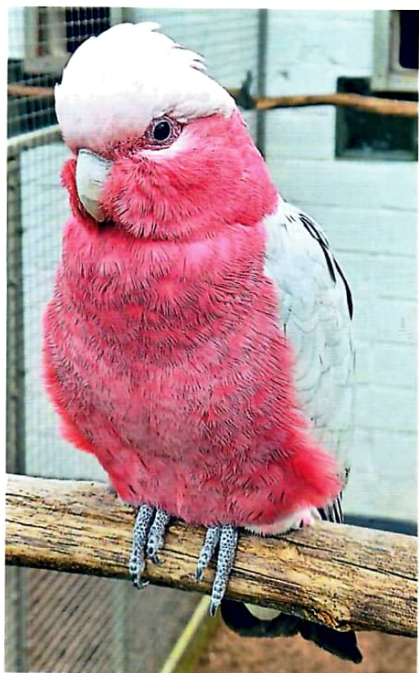
7: Rosakakadu ( Eolophus roseicapilla ), auch bekannt als Cacatua roseicapilla