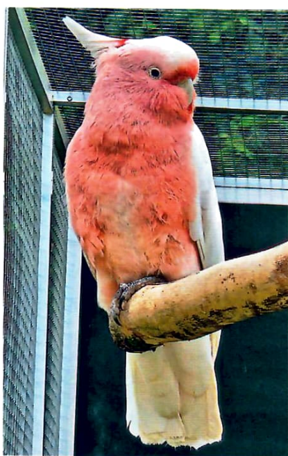
8: Inkakakadu ( Lophochroa leadbeateri ), auch bekannt als Cacatua leadbeateri

eindrucksvoll erläutert. Beide Vorträge waren rundum gelungen. Danke dafür!