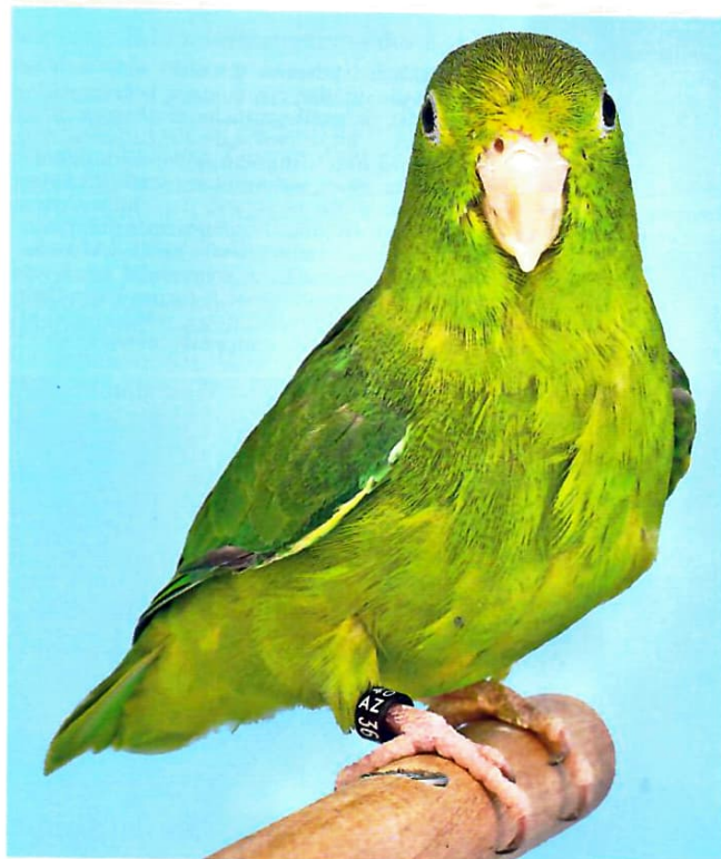
9: Grünbürzel-Sperlingspapagei ( Forpus passerinus ), Weibchen