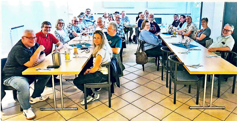
1: Freitagabend im Nebenzimmer der Gaststätte „Zum Posthorn“